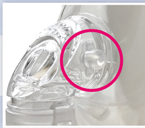
圧力やETCO 2 測定用 サンプリングポート付き