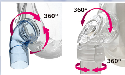
360°自由に回転する エルボーコネクターおよびアダプター