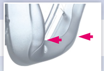
人間工学に基づいた 下顎部のマスククッション設計