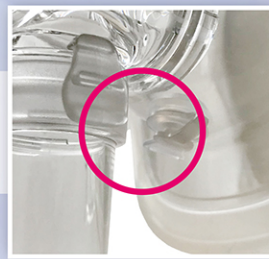
経鼻胃チューブ用 サンプリングポート付き